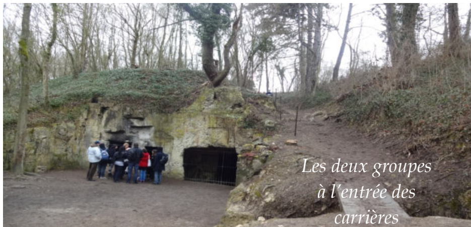
Les deux groupes à l'entrée des carrières

Pour la matinée, nous avons, avec l'aide de Michel Pugin, choisi la visite des Carrières de Confrécourt. Le car et les élèves, avec les accompagnants, sont au rendez-vous....Petit arrêt à Soissons pour prendre les deux guides du Syndicat d'initiative, et en route ! L'une d'entre elle a situé historiquement et géographiquement la bataille du Chemin des Dames. L'accès au site des carrières demande un petit effort, mais on est récompensé par le paysage et l'intérieur des grottes !