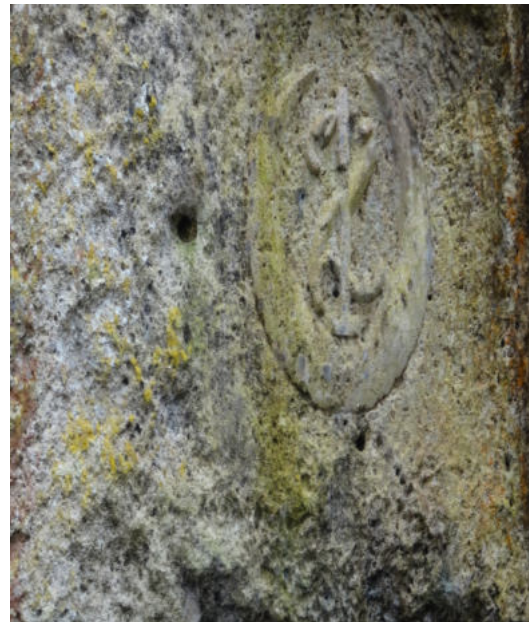
Insigne du régiment de Spahis qui a occupé la carrière