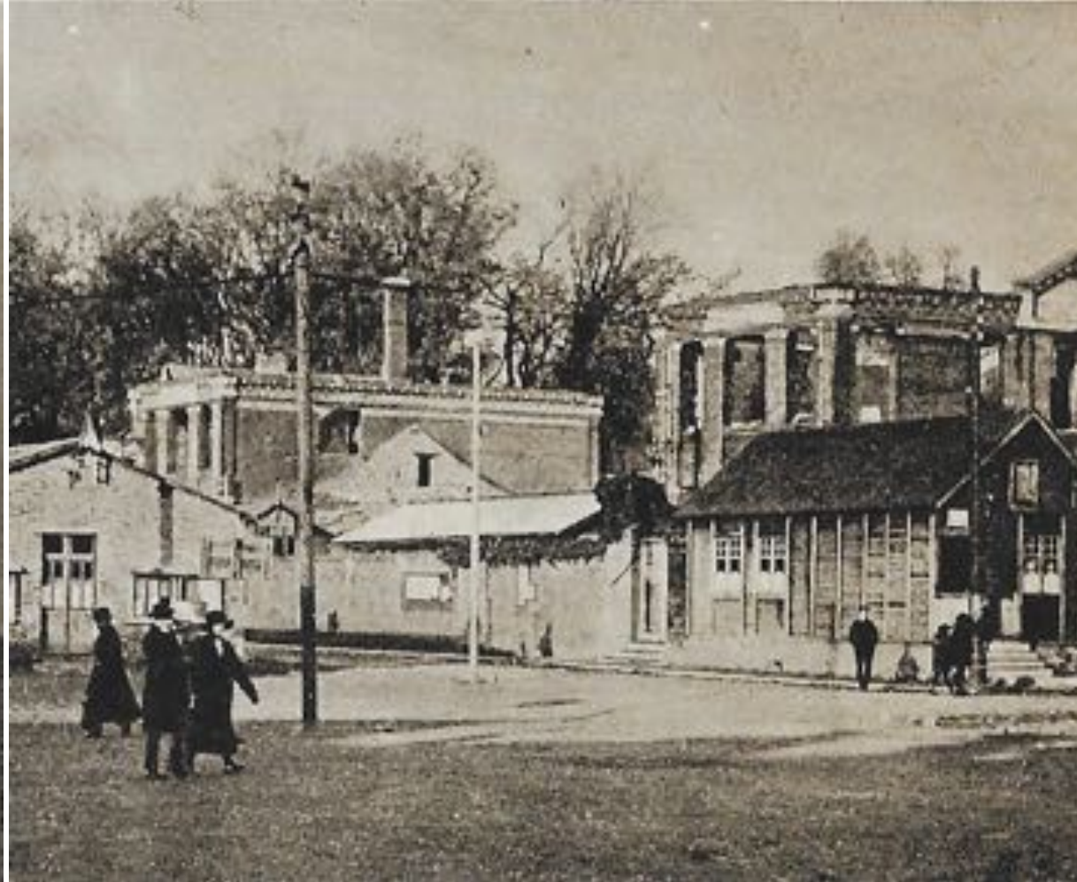
Ruines et baraques