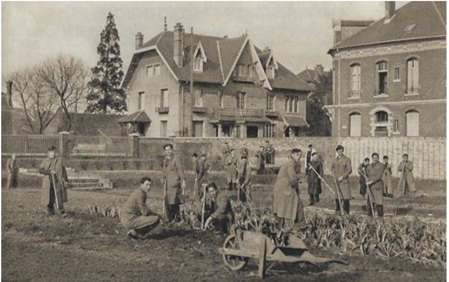
Le champ d'expériences