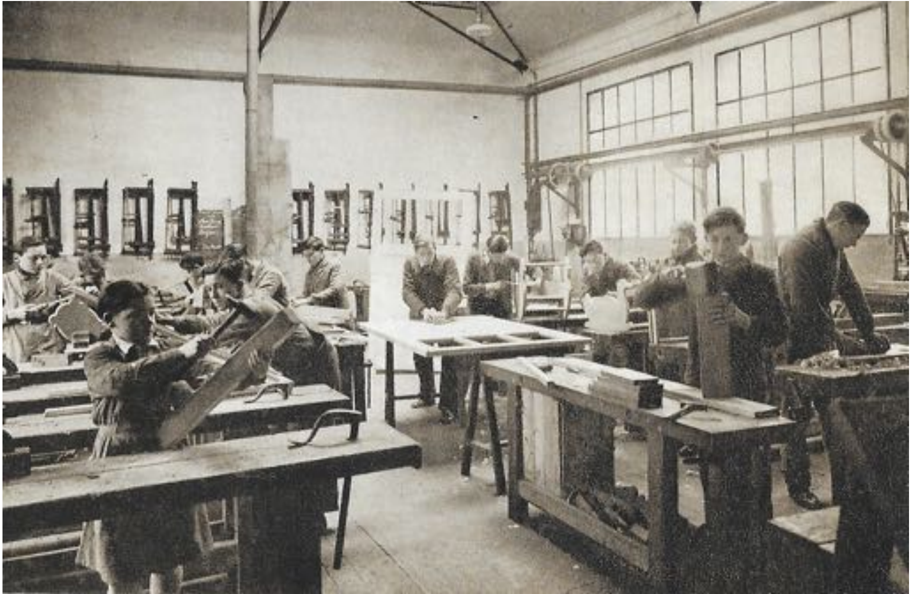
Atelier du bois