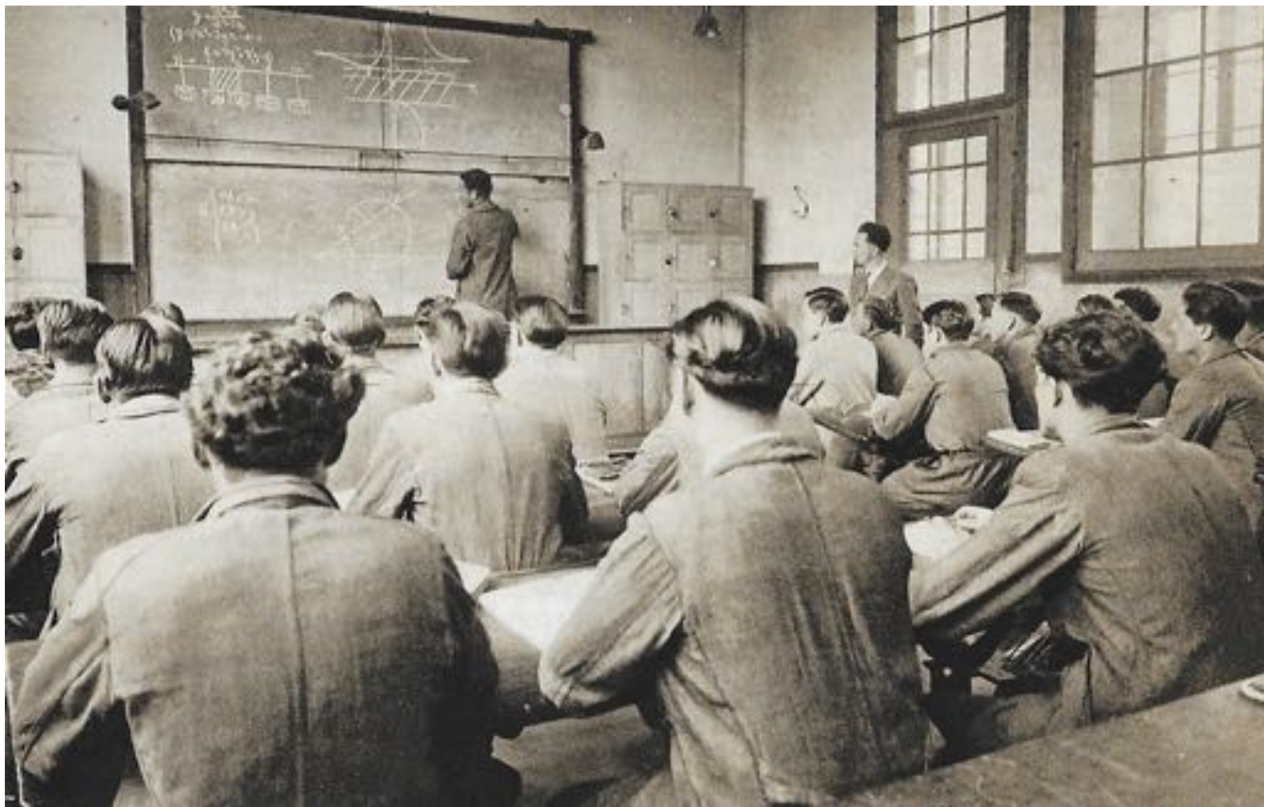
Salle de classe (Mathématiques)

Les services d'Enseignement sont parfaitement étudiés.