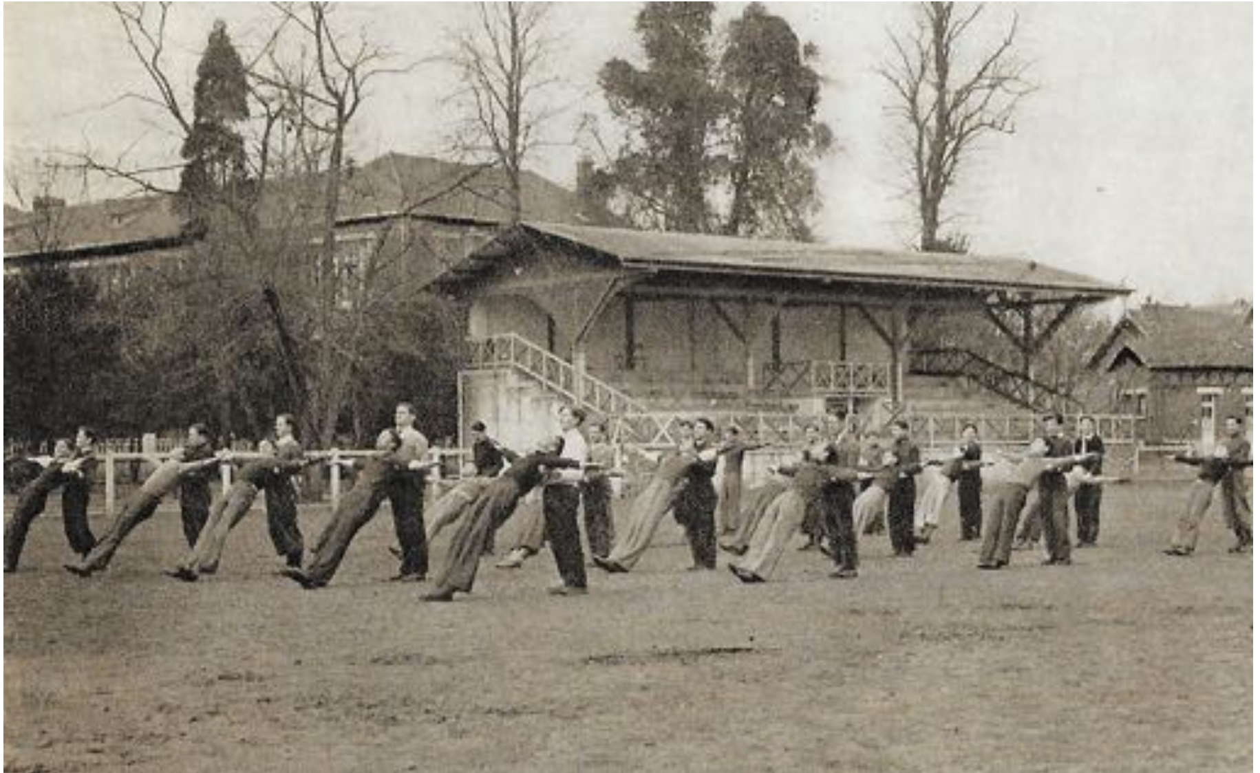
Leçon Education Physique Garçons

Les sports et l'Education Physique sont à l'honneur dans l'établissement