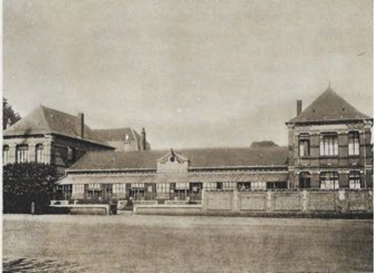
Ecole de la place Bouzior